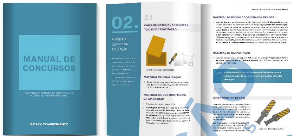
Figura 2.7.2 – Manual de Concursos